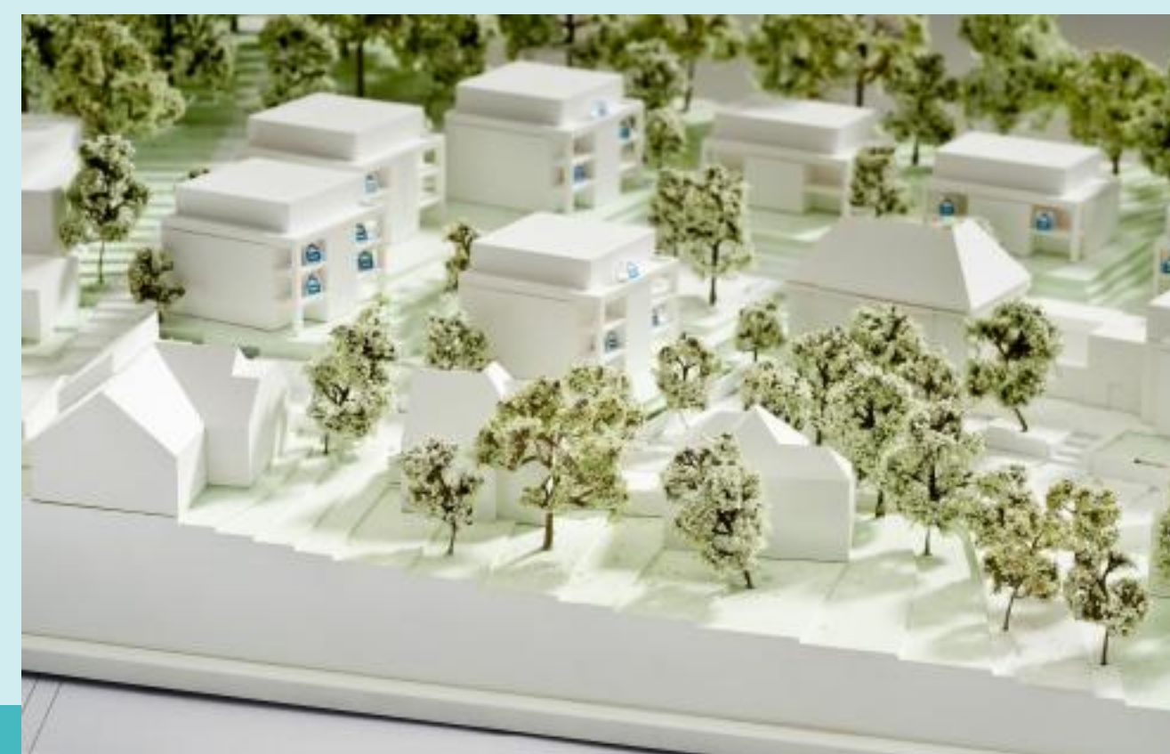
seit 1997: Projekt- entwickler & -Makler