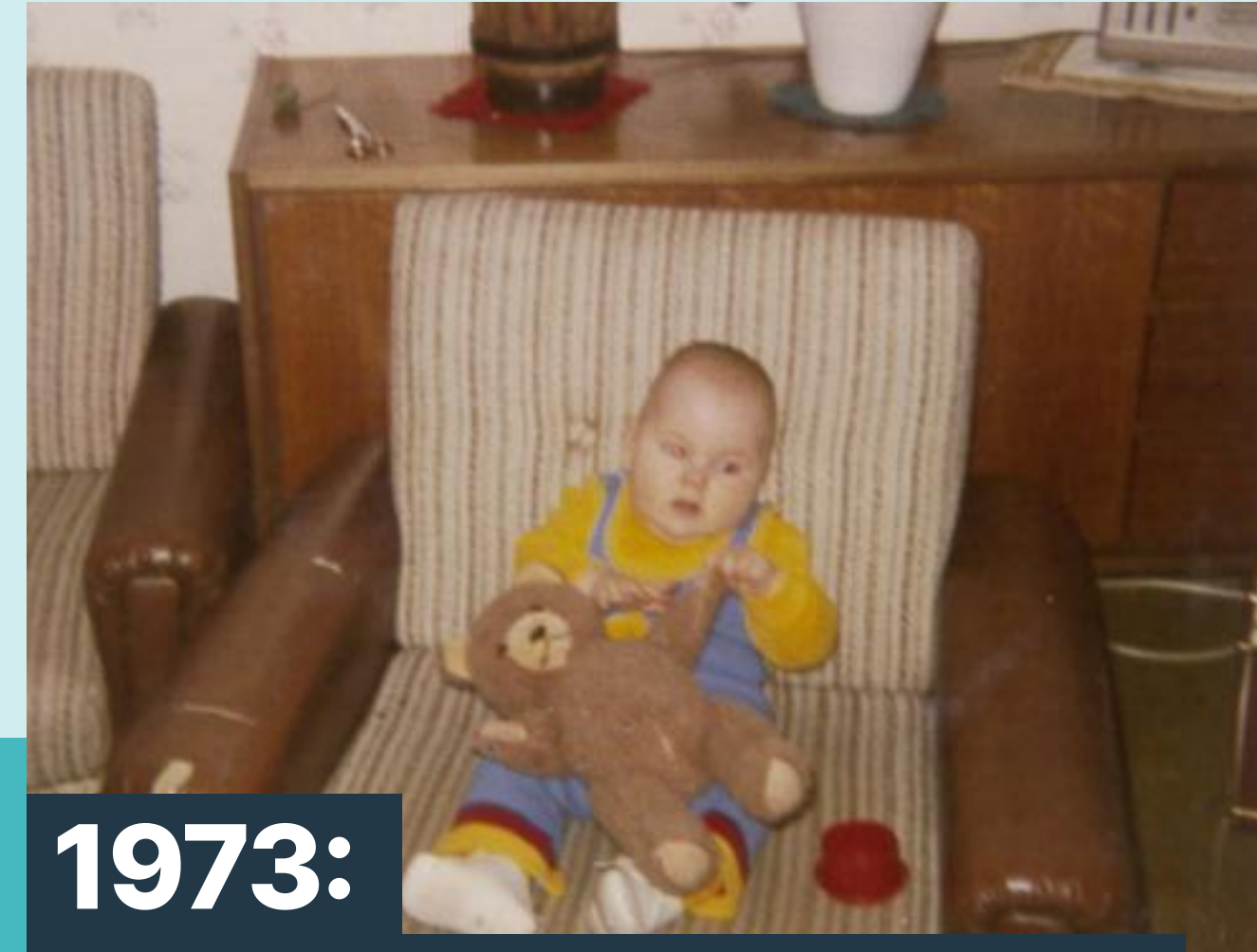
1973: Geboren in Ochtrup

Bewährtes erhalten - Neues möglich machen!