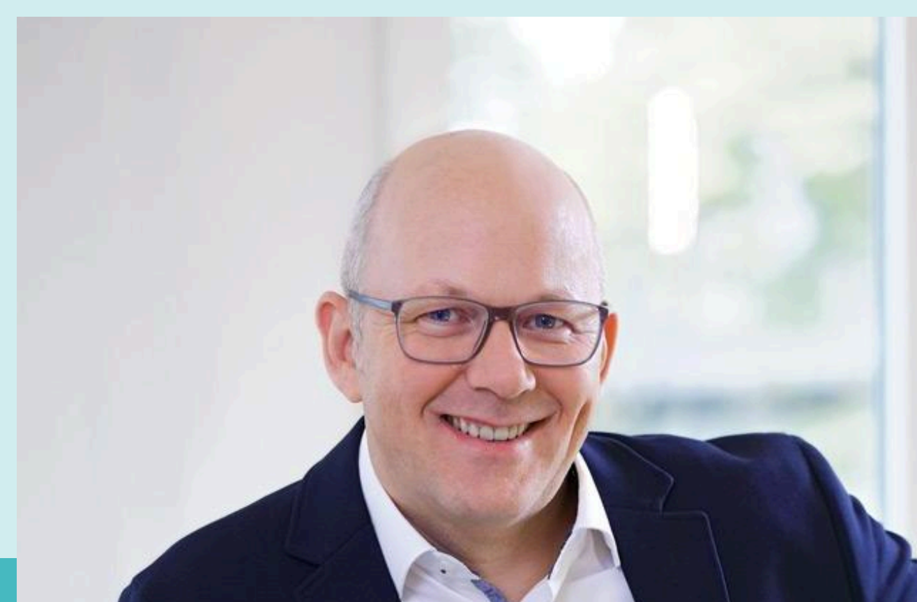
2025: Ihr Bürger- meisterkandidat