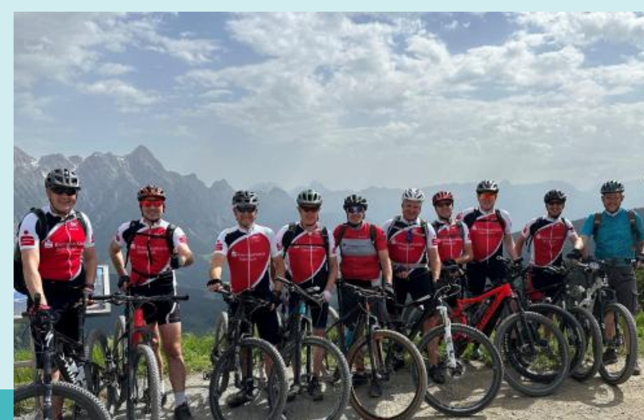
2011: Gründung des RSV Metelen